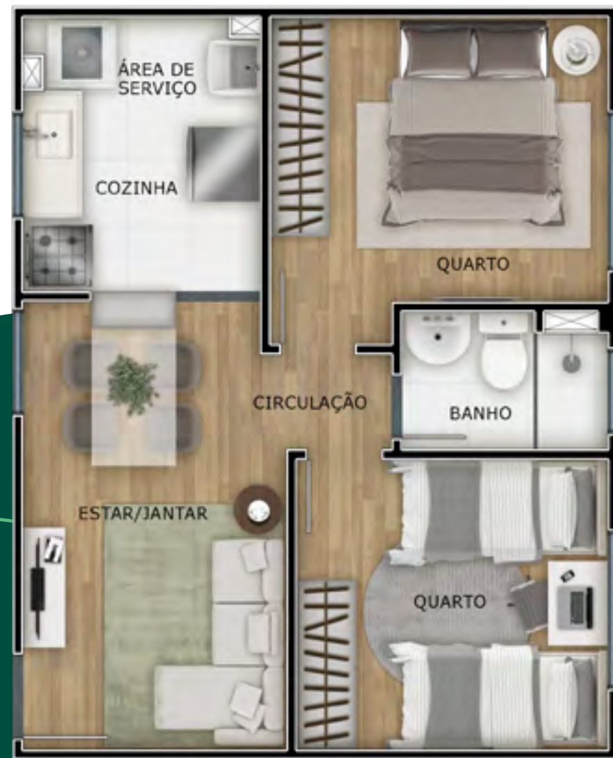
Apto 303 | Bloco 09