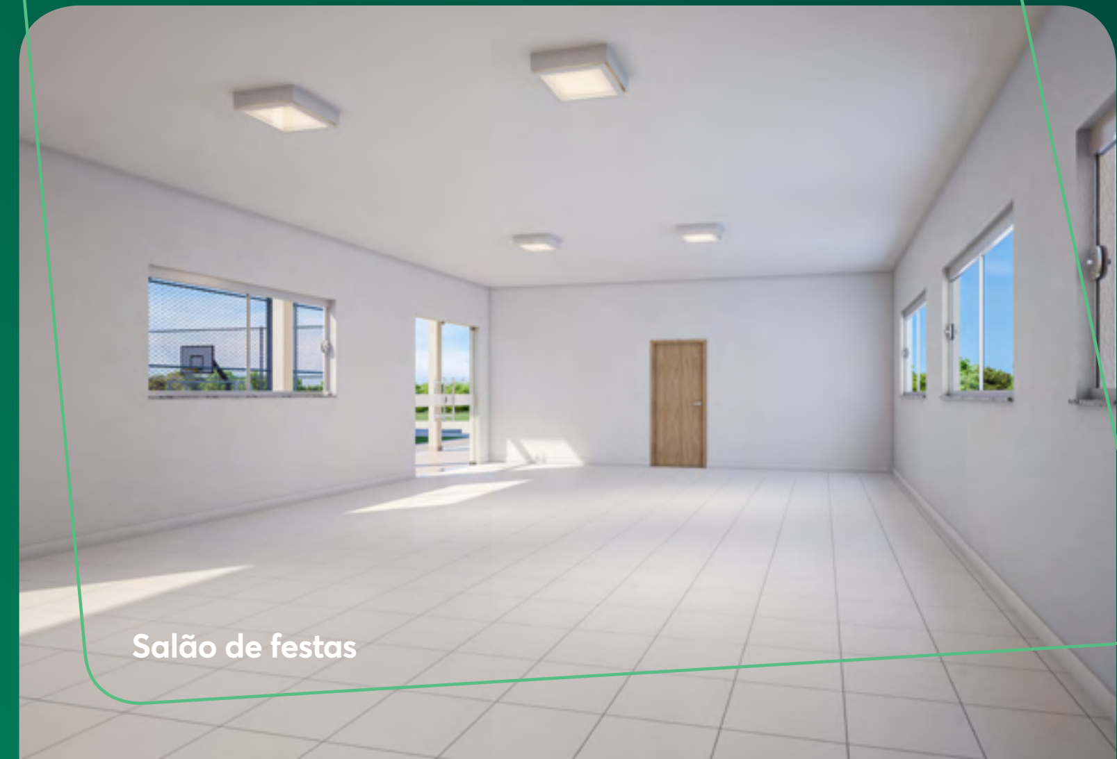
Salão de festas

Nas horas de comemorar, tudo fica mais saboroso.