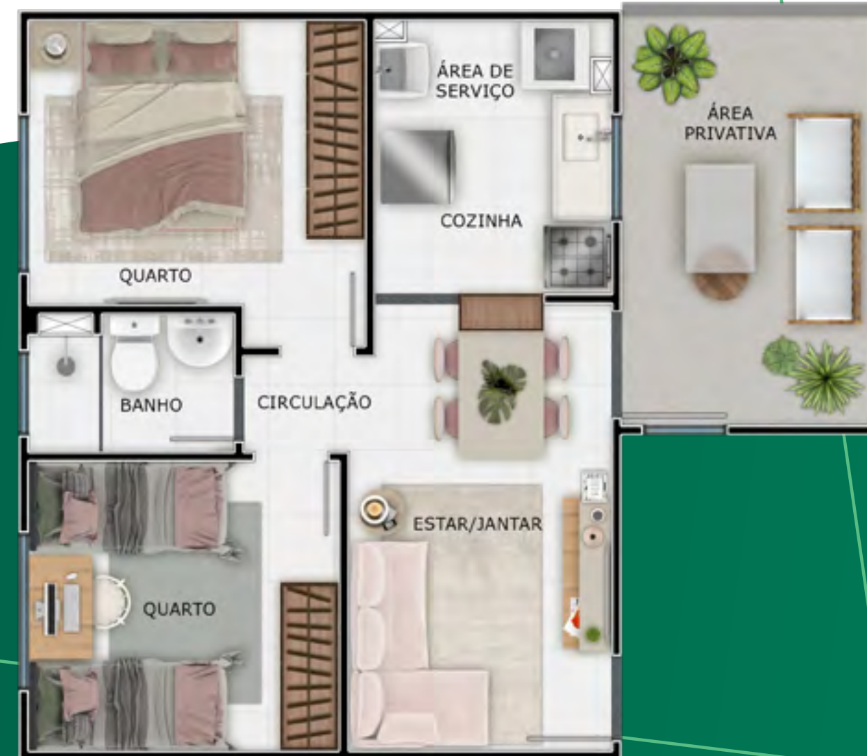
Apto 101 | Bloco 08